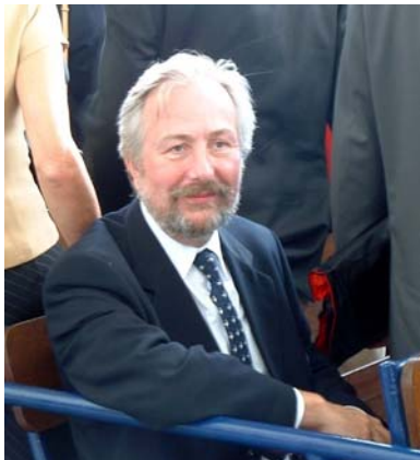
Ó Bernard VANROYE

La tâche de Député permanent en province de Hainaut est enthousiasmante par la diversité des projets à mener au service de la population. Le constat est valable pour toutes les matières qui font partie des compétences qui me sont attribuées depuis le 20 octobre 2000. Proximité, efficacité et transparence sont trois aspects auxquels je m'attache particulièrement.